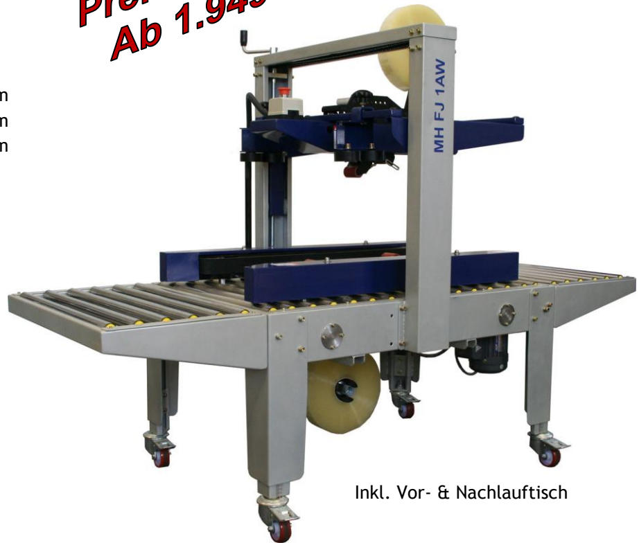
Inkl. Vor- & Nachlauftisch