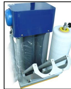
Powerstretch-System 250% Vordehnung, elektromagnetische Folienbremse